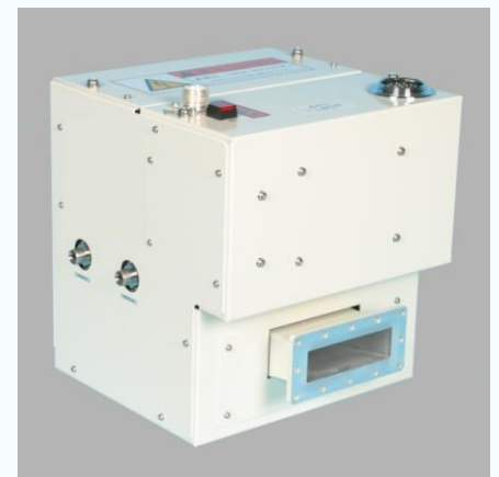
マグネトロン発振部 (MG-30CT-W)